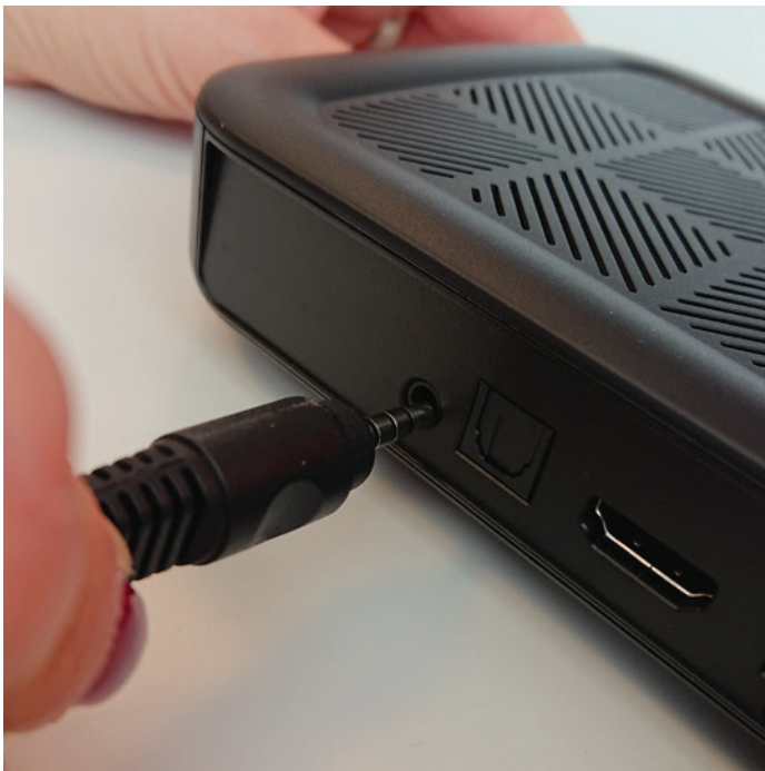
SCART kabel vključite v tako pripravljen vhod na TV vmesniku.